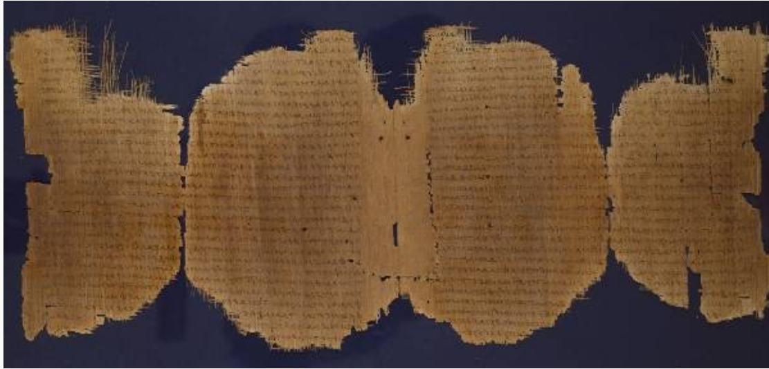
Papirus 45 (Chester Beatty I) – kodeks z III w. zawierający fragmenty czterech ewangelii i Dziejów Apostolskich.