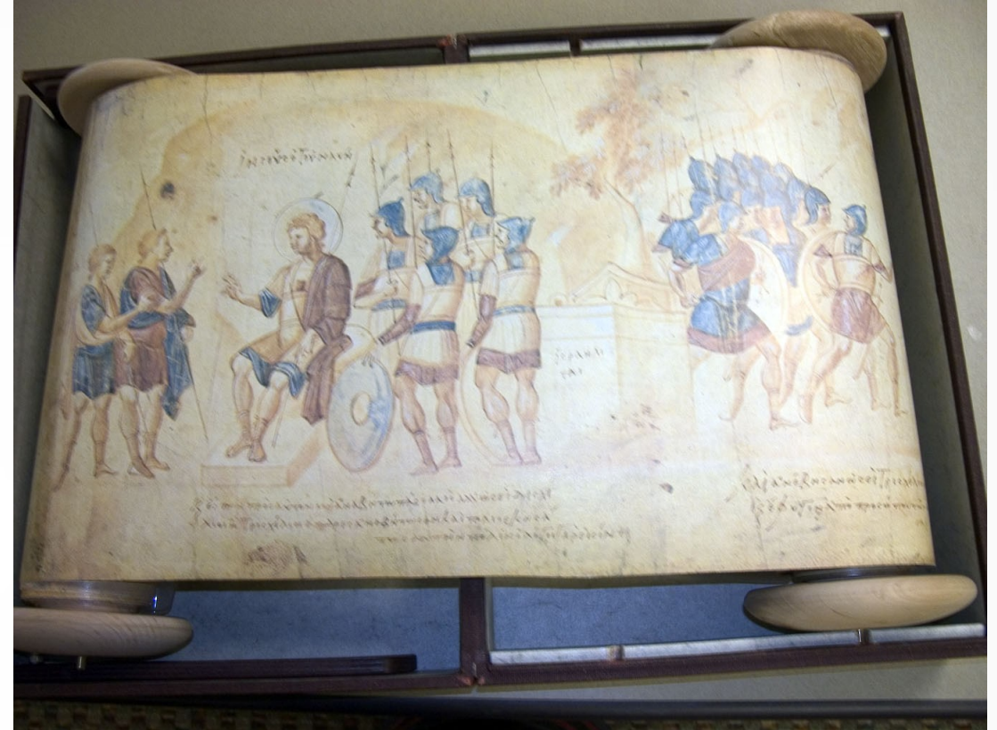
Zwój Jozuego – pergaminowy zwój z X w. zawierający grecki tekst Księgi Jozuego.